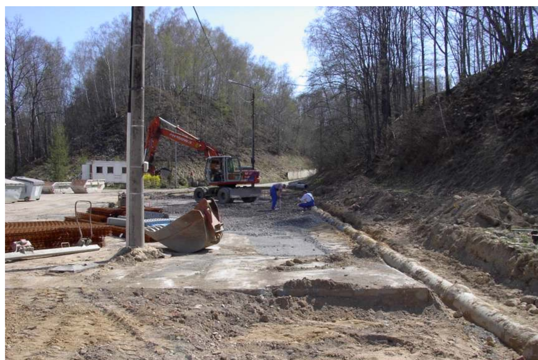
Mai 2003: Neugestaltung Kleinanlieferbereich, im Hintergrund: Eingangskontrolle mit Waage