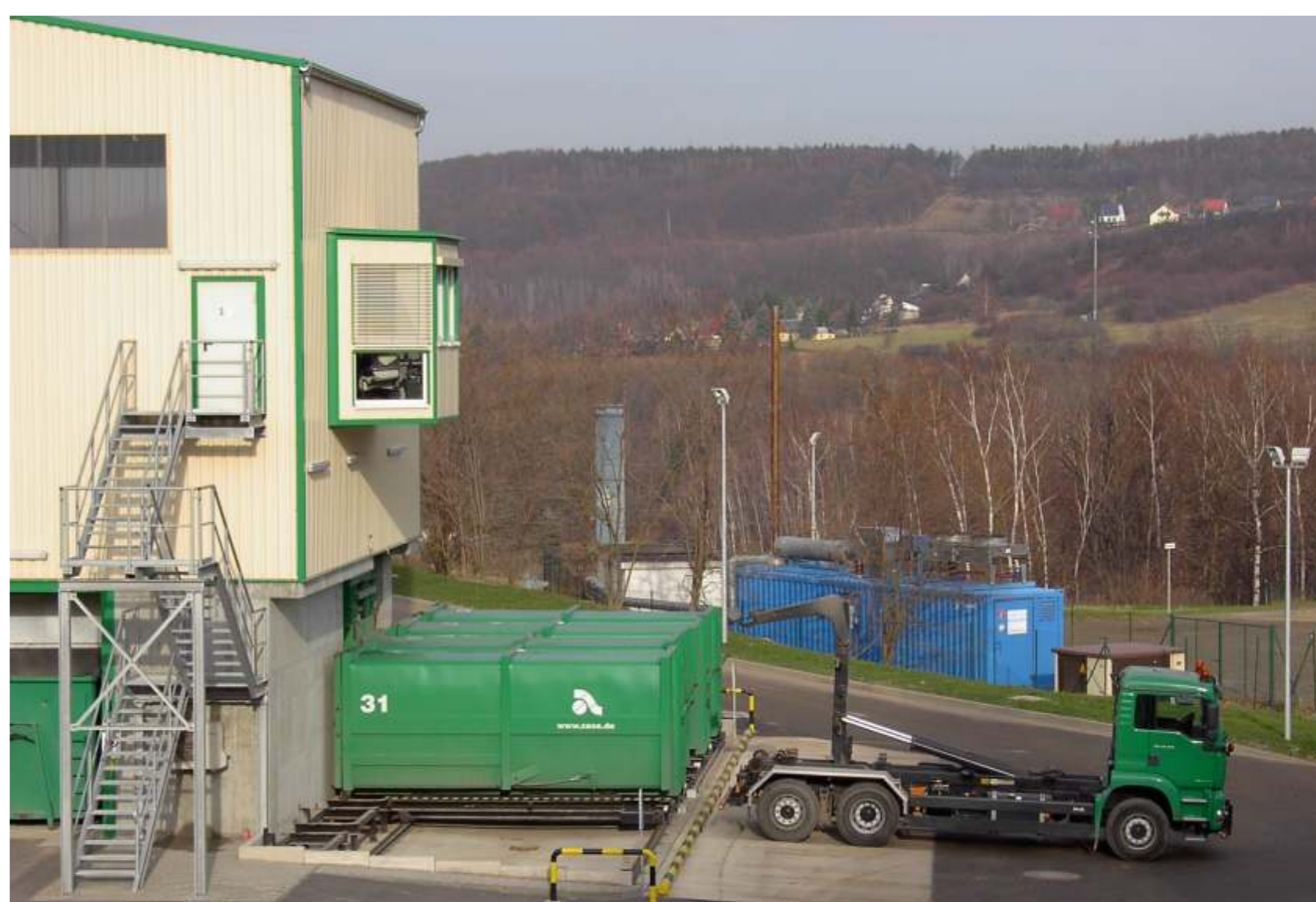
Juli 2003: Umladestation in Betrieb, links im Bild: ein "ausgedienter" Kompaktor