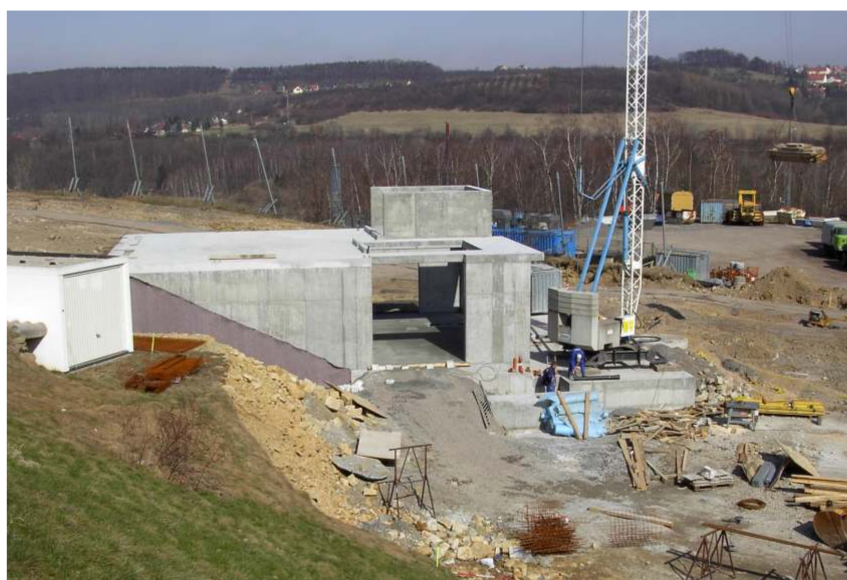
März 2003: der Rohbau