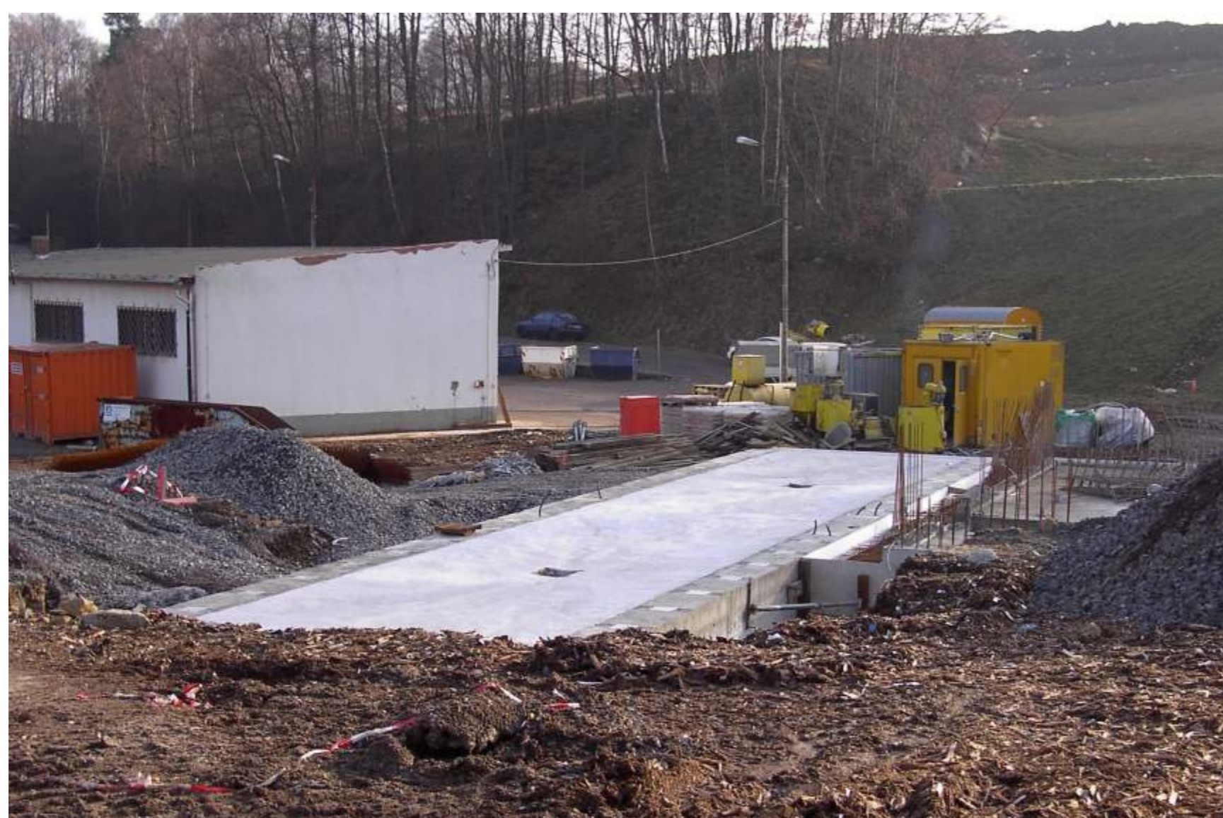
Januar 2003: das Fundament