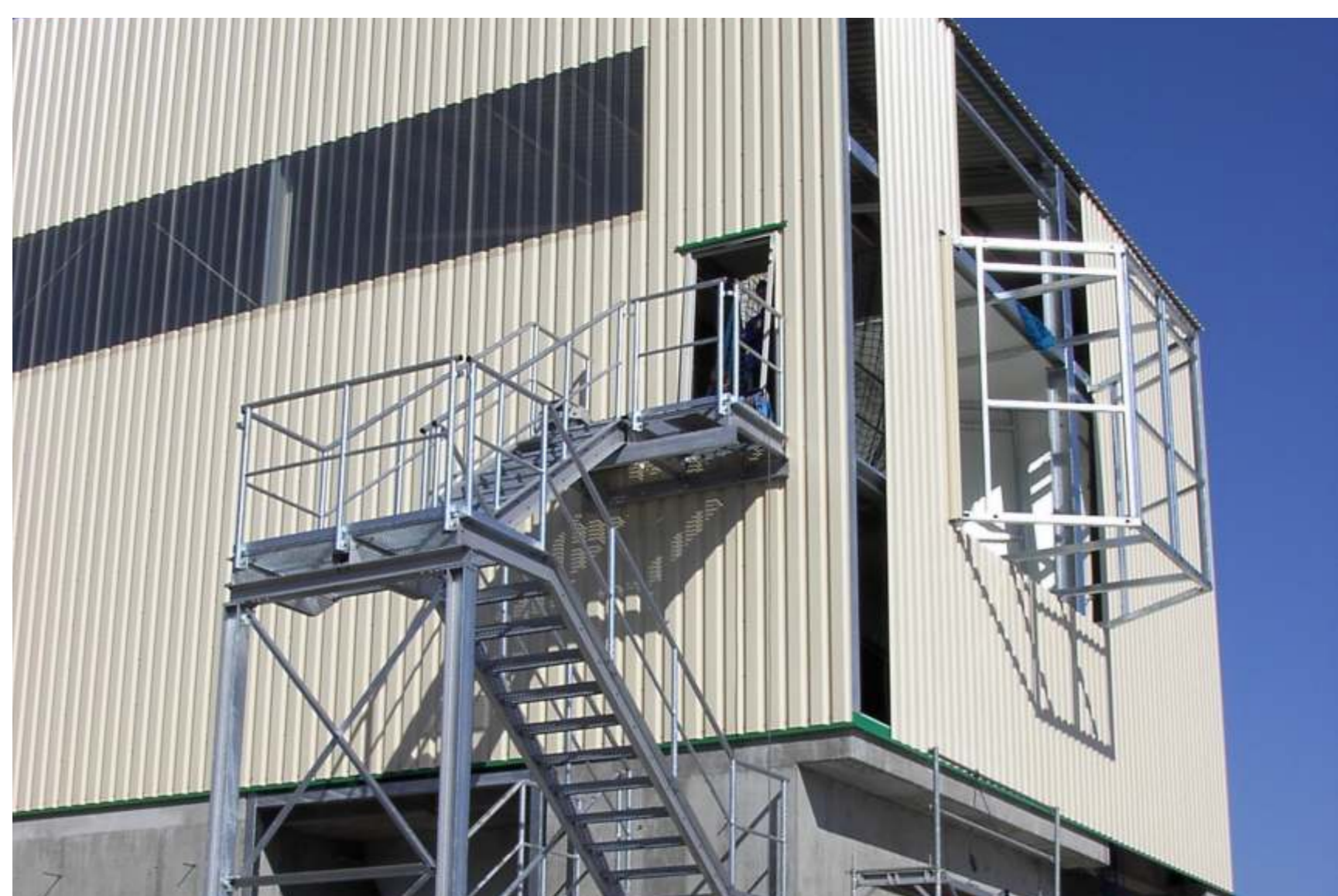
April 2003: Verkleidung der Halle